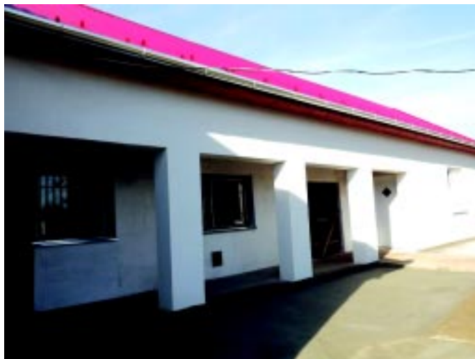
Az újonnan készült irattár épülete

Biztosítani szeretnénk a lakosságot, hogy ez csak az első lépés. Nem feledkeztünk meg a többi bel- és külterületi lakóövezetről és a mezőgazdasági földutakról sem, hiszen számos helyszín található a településen, ahol égető sürgősségű a beavatkozás, vagy új járófelület készítése. Reményeink szerint még a 2014-es évben sikerül meg-