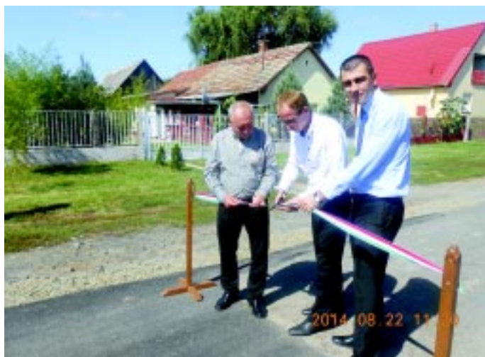
Bartók Béla út átadóünnepsége

Szintén elengedhetetlen beruházás volt a Polgármesteri Hivatal udvarán, egy irattári helyiség építése, amely eddig a Kossuth u. 93. szám alatt található szolgálati lakásban kapott helyet. A tavaly évi „Fecskek lak és Kiállító terem kialakítása” megnevezésű fejlesztés révén ezen épületegyüttes új funkciót kapott, így nem használhattuk tovább irattárként. Mivel a hivatal épület helyiségeinek száma korlátozott, így ezt