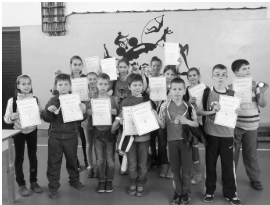
A jövő reménységei

Legújabb foglalkozásainkat a SAP Hungary Kft támogatja. A hozzájuk írt 2 db Digitális Esély pályázatunk nyert, így a támogatás összege közel 1 200 000 Ft. Ennek keretében ismét 10 diáknak nyílik lehetősége, hogy ingyenes ECDL vizsgát tegyen 4 modulból. A vizsgakártya díjukat, a felkészítést és a vizsgák díját, az utazás költségét is ebből a pályázatból fedezzük. 11–14 éves diákok jelentkezhetnek a felkészítésre. 100 tanórányi ingyenes foglalkozás vár rájuk. Másik pályázatunknak köszönhetően a 6-10 éves kisdíákok ismerkedhetnek az informatika vilá-