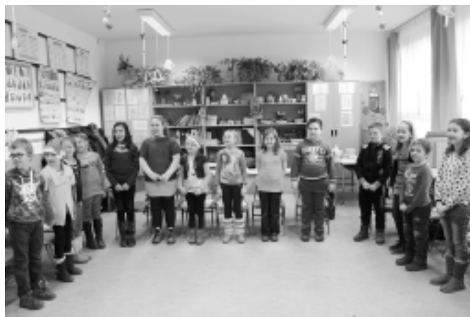
Énekszóval várták a Mikulást a gyerekek