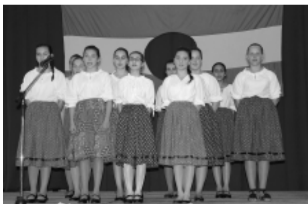
Az október 23-i ünnepségen a 7. évfolyam lányai adtak műsort

Az 1956-os forradalom és szabadságharc a 20. századi magyar történelem egyik legmeghatározóbb eseménye volt. Ebből az alkalomból emlékeztünk meg október 22-én iskolánkban.