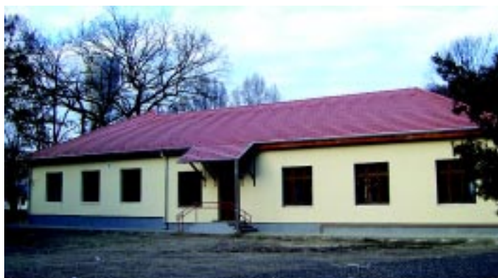
A Gondozási Központ új épülete

Mindenkit szeretettel várunk új intézményünkben.