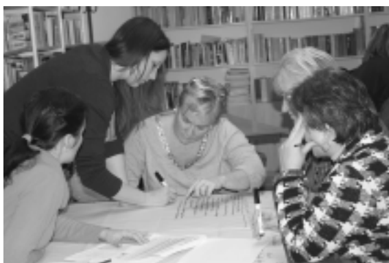
Folyik a műhelymunka a KLIK által szervezett tréningen, amelynek fő témája a szervezetfejlesztés volt

November 24-26-ig tartottuk a nyílt tanítási napokat, melyre szívesen és nagy létszámban látogattak el a kedves szülők,