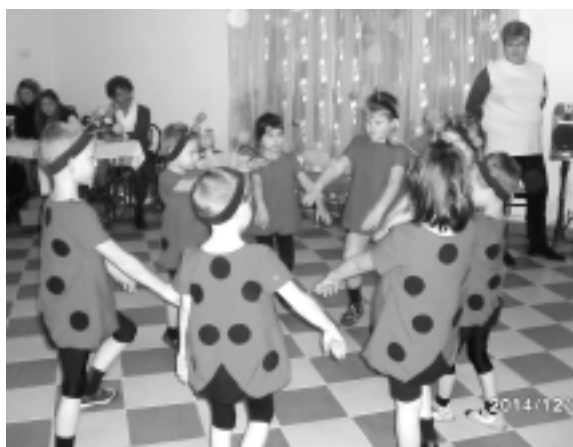
A kis katicák műsorral kedveskedtek a meghívott vendégeknek

Ficánka Egységes Óvoda és Bölcsőde gyerekei és dolgozói