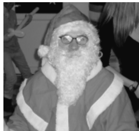
A Mikulást már nagyon régen várták a gyerekek